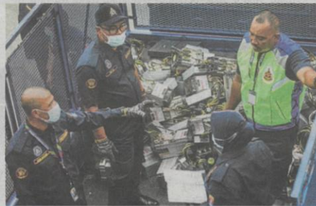
ANTARA peralatan melombong bitcoin yang dirampas.

Premis lombong bitcoin usik meter, buat sambungan secara haram kena serbu