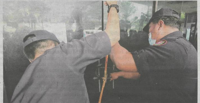
Penguat kuasa MBSA memotong kunci pintu premis judi pada operasi bersepadu untuk membanteras penaja dan peniaga tanpa kebenaran berikutan isu tular di sekitar Bandar Baru Sungai Buloh semalam.