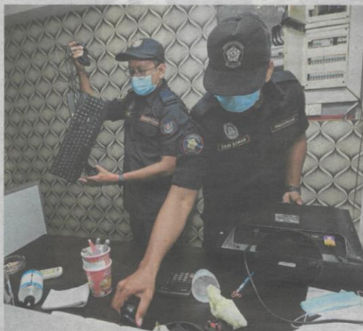
Anggota penguat kuasa MBSA merampas peralatan di sebuah premis dipercayai kedai judi di Sungai Buloh.

Beliau turut mempersoalkan tindakan pihak berkuasa mengenai kompaun terhadap perniagaan gerai bujurnya, tetapi tidak kepada peniaga lain di kawasan itu.