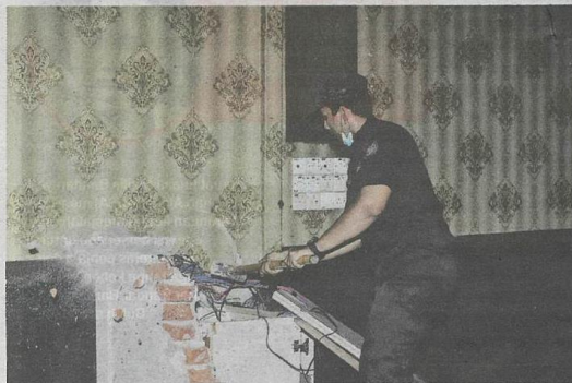
Penguat kuasa MBSA memecahkan premis yang dijadikan kedai judi haram semalam.

“Namun beliau telah menolak pelawaan yang diberikan oleh pihak MBSA dan meneruskan perniagaan di bahu jalan yang telah menimbulkan isu keselamatan dan lalu lintas sehingga tindakan diambil ke atas gerai itu,” katanya.