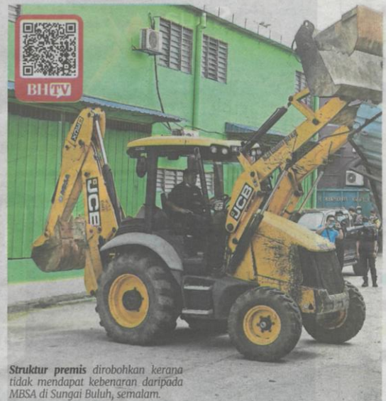
Struktur premis dirobohkan kerana tidak mendapat kebenaran daripada MBSA di Sungai Buloh, semalam.

"Salah sikit pun nak saman, pasang awning (sengkuap) untuk tahan air hujan pun kena saman, tangga untuk naik turun pun kena saman. Ada kedai yang sudah berpuluh tahun buat tambahan, diarahkan ubah dalam tempoh 24 jam," keluhnya yang berniaga di