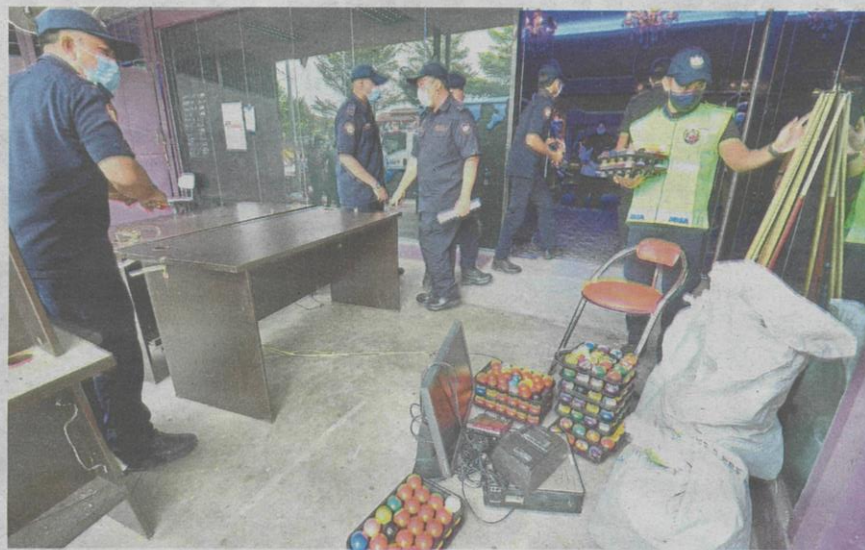
Close shop: Shah Alam City Council enforcement officers confiscating furniture from premises believed to be an illegal gambling den in Bandar Baru Sungai Buloh.

ment, he said that MBSA was willing to commit and work with MACC to ensure the council's integrity was not compromised.