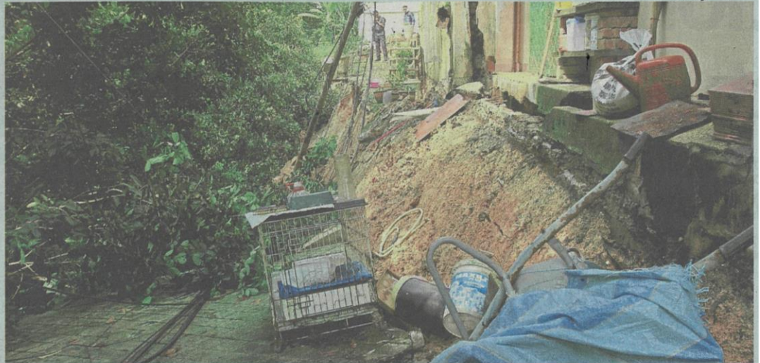
The retaining wall behind the seven double-storey houses at Jalan Kelab Ukay 4 collapsed and residents had to be evacuated in the May 30 incident.

Irrigation Department (DID) to carry out emergency works to repair and strengthen the collapsed slope.