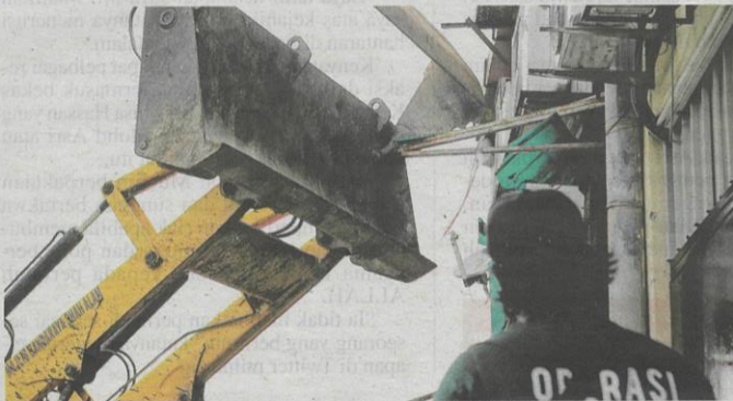
Jengkaut turut digunakan dalam operasi membanteras premis judi di Bandar Baru Sungai Buloh.