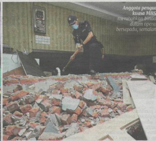
Anggota penguat kuasa MBSA merobohkan binaan dalam operasi bersepadu, semalam.