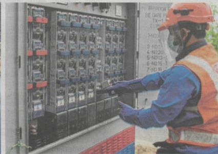
KAKITANGAN TNB melakukan pemotongan bekalan elektrik.