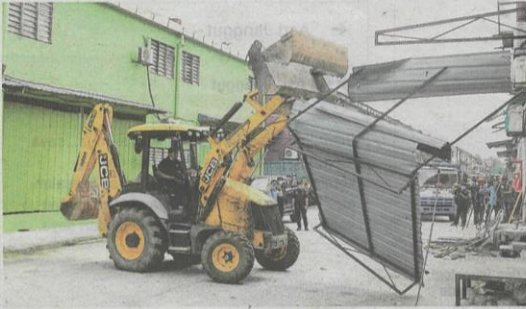
Penguat kuasa MBSA meruntuhkan struktur binaan tambahan di premis judi yang diserbu di Bandar Baru Sungai Buloh semalam.