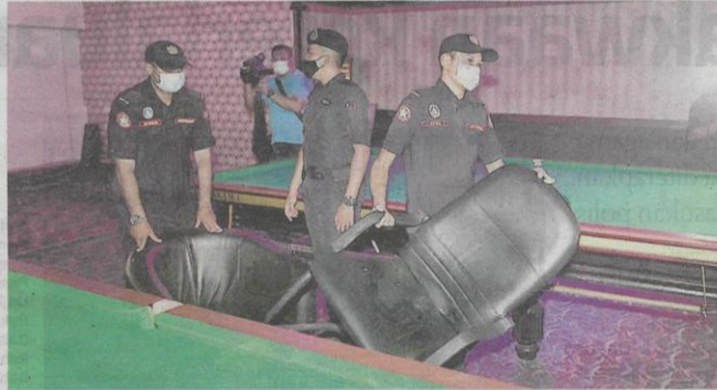
Anggota penguat kuasa MBSA mengempur premis judi yang berselindung di sebalik kedai pusat sukan.