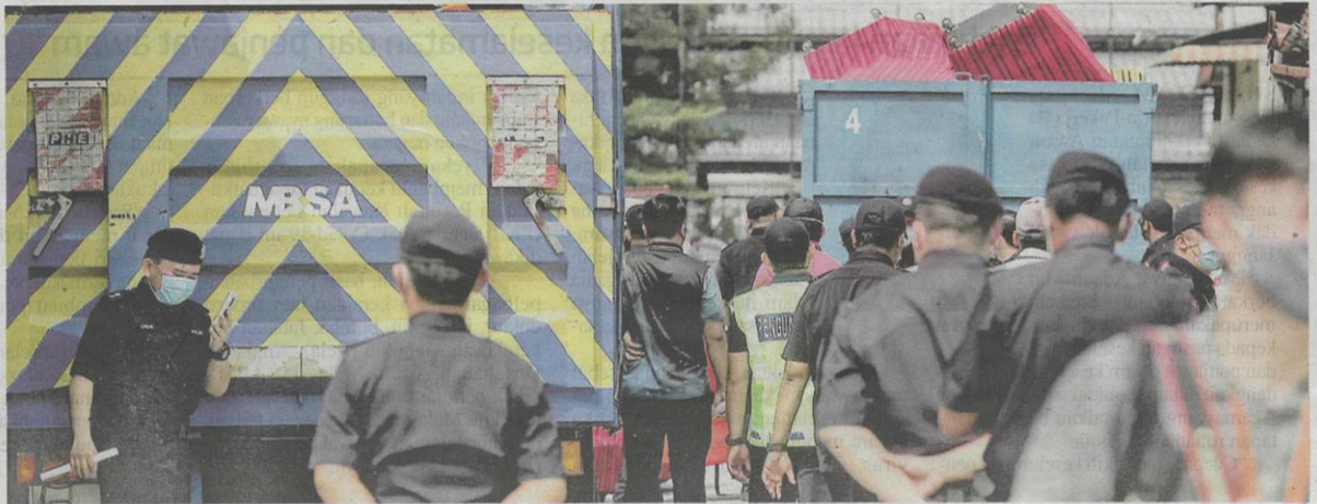
Seramai 230 petugas MBSA, Polis Diraja Malaysia (PDRM), Jabatan Imigresen, Jabatan Kastam, Suruhanjaya Pencegahan Rasuah Malaysia (SPRM), TNB dan Air Selangor turut serta dalam operasi bersepadu itu.