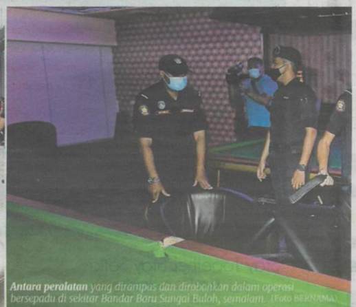
Antara peralatan yang dirampas dan dirobohkan dalam operasi bersepadu di sekitar Bandar Baru Sungai Buloh, semalam.