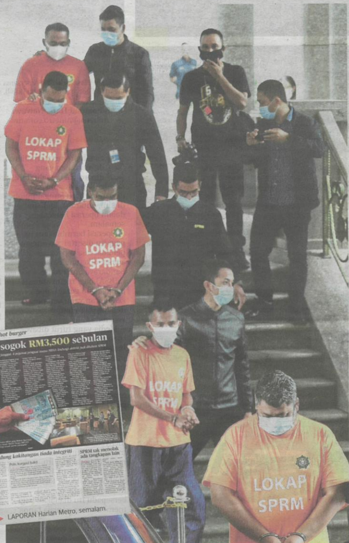
LIMA suspek lelaki diiringi pegawai SPRM tiba di Mahkamah Majistret Putrajaya untuk permohonan reman, semalam.

Seorang lagi dari MBSA Shah Alam. Seorang peniaga rokok seludup keturunan Aceh yang tidak mempunyai sebarang dokumen turut ditahan.