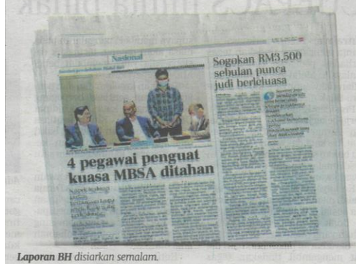
Laporan BH disiarkan semalam.

Seorang peniaga rokok seludup keturunan Aceh yang tidak mempunyai sebarang dokumen turut ditahan.