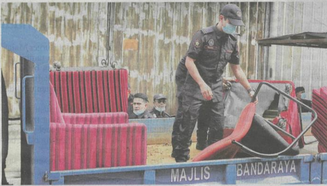
Semua peralatan dibawa menaiki lori MBSA selepas tindakan sitaan dilakukan semalam.