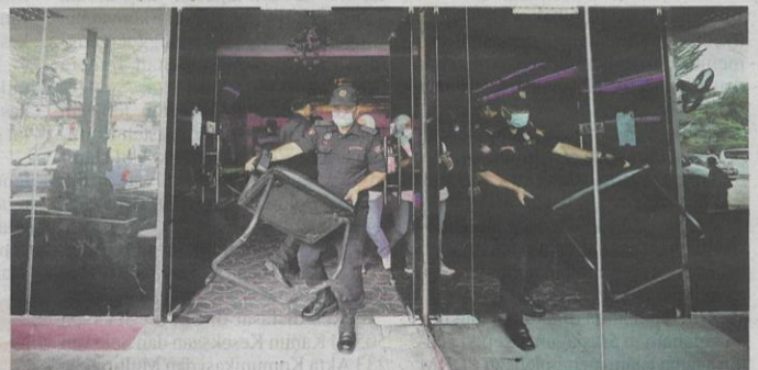
Barangan seperti kerusi dan meja dibawa keluar dari premis judi yang digempur untuk tindakan sitaan.