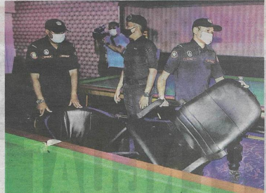
MBSA menyita peralatan di premis judi pada operasi bersepadu untuk membanteras penaja dan peniaga tanpa kebenaran berikutan tular isu judi haram di sekitar Bandar Baru Sungai Buloh semalam.

“Operasi pada hari ini (semalam) juga dijalankan terhadap premis perniagaan serta gerai-gerai atas kesalahan sama termasuk gerai tanpa lesen yang beroperasi di bahu jalan sehingga mengakibatkan kesesakan lalu lintas,” katanya pada sidang akhbar selepas satu operasi ber-