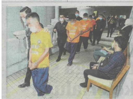
Empat penguat kuasa serta seorang peniaga rokok seludup direman di Mahkamah Majistret Putrajaya, semalam.